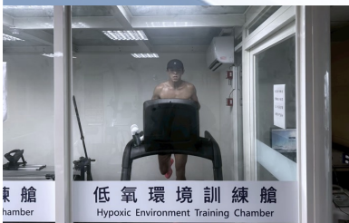
訓練室 chamber 低氧環境訓練館 Hypoxic Environment Training Chamber