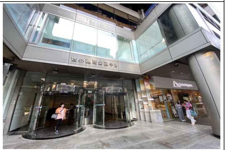
6.大門-世界通商金融中心(台北市復興北路 99 號)