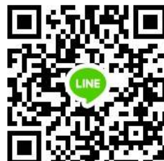
新生招生說明群組